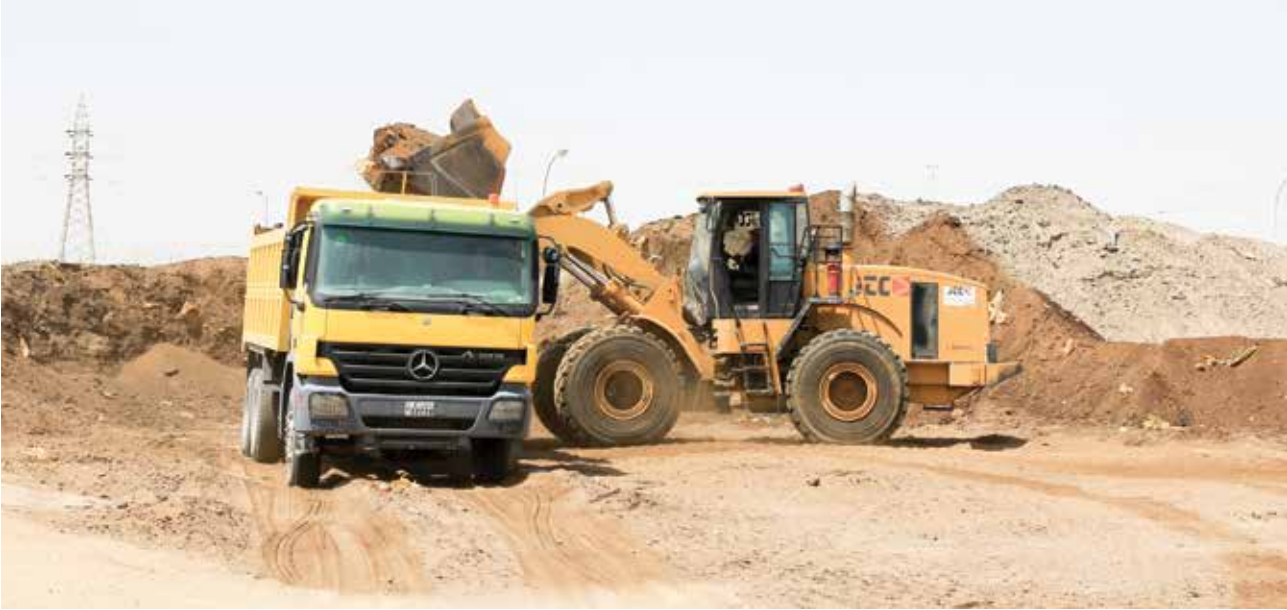
4 أدوات تسهم الإدارة الجيدة لها في نجاح المشروع خلال مرحلة الإنشاء