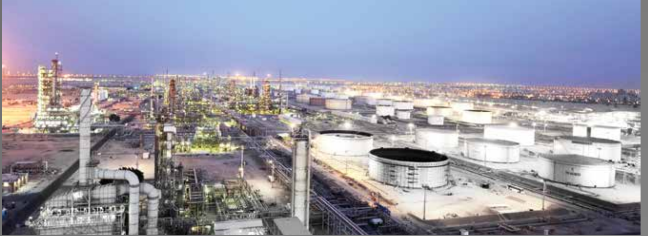
■ التعامل مع فرص الربحية المتاحة من شأنه تعزيز كفاءة وإمكانيات الشركة