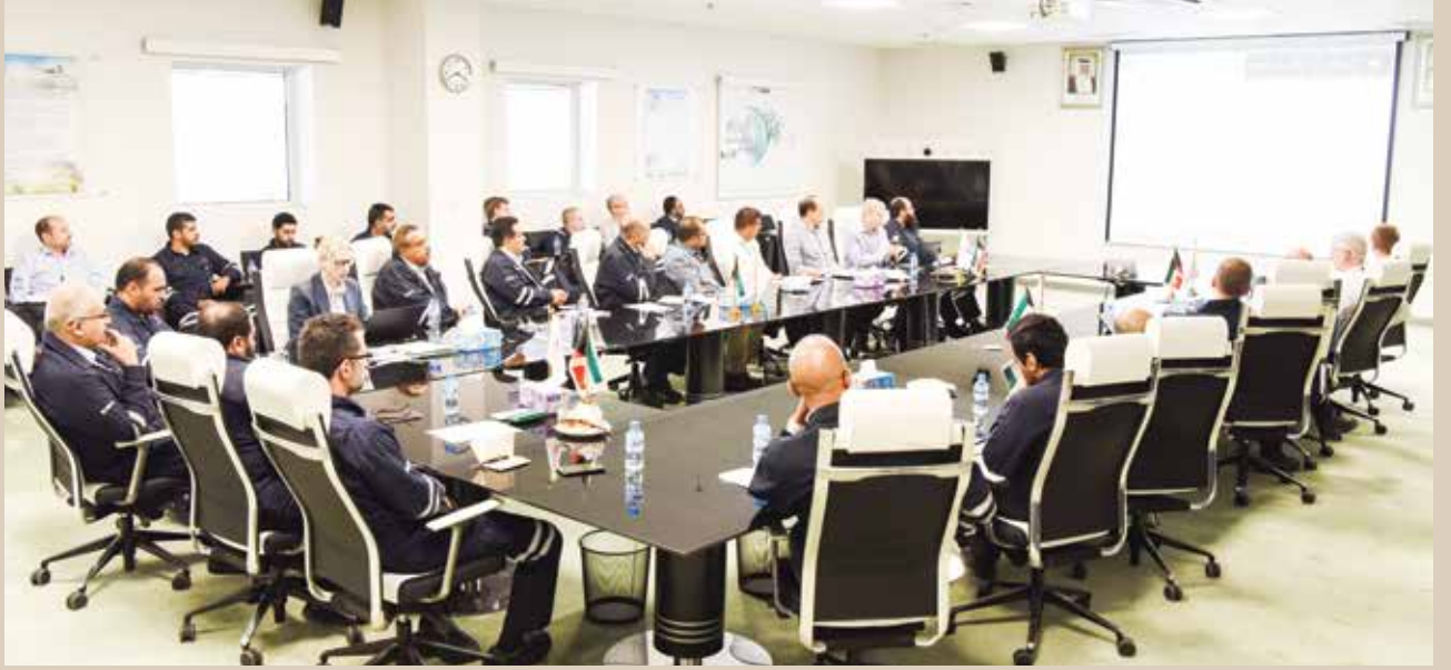
■ تكامل الجهود يتطلب التعاون والعمل الجماعي