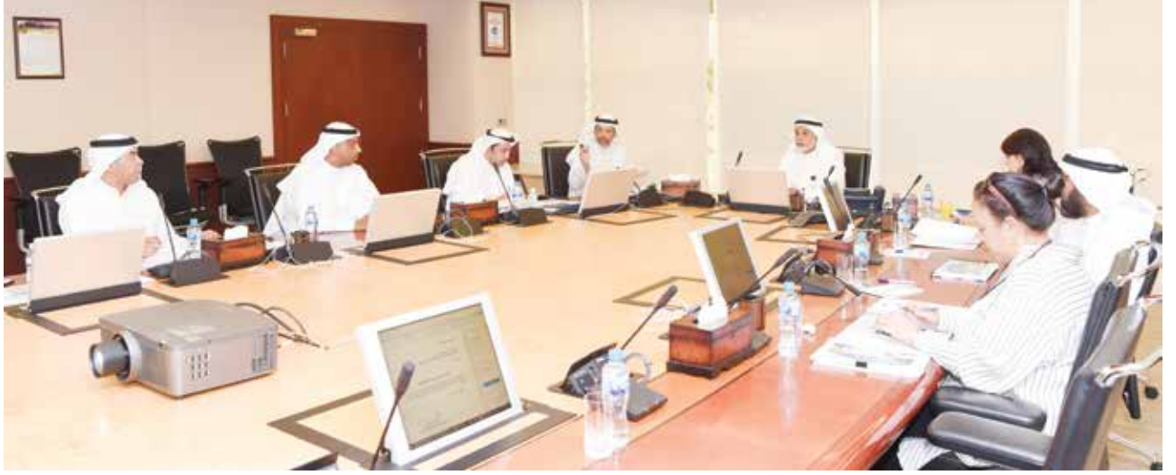
■ فريق العمل المتجانس والمتعاون يقود إلى التميز

خطأ صاعداً نحو الأعلى، بل هو أشبه بحلقة، لأنه مهما ارتفع نجاحك وثقتك بنفسك، فإن ذلك سيعود حتماً إلى موظفيك.