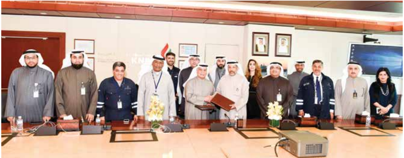
■ تسعى الشركة من خلال بناء محطات التعبئة الجديدة إلى تلبية احتياجات الجمهور