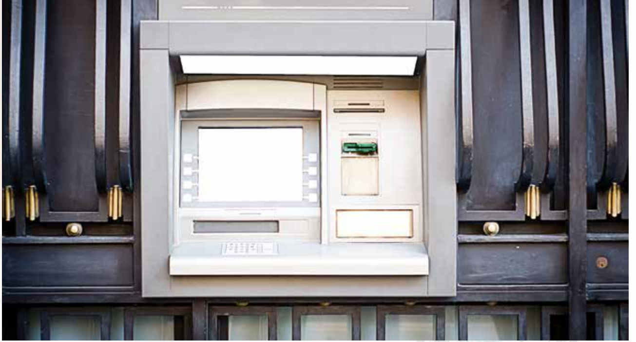
■ ماكينات الصرف الآلي التي يستخدمها الجميع اليوم لم تكن كذلك في بداياتها