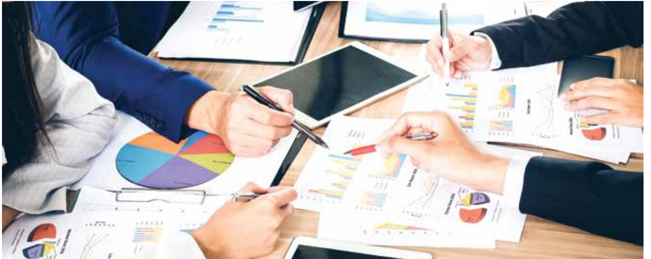
■ التخطيط المتقن للأعمال يضمن النجاح وتجاوز العثرات

الإنشاء الأربع، وهي المرحلة المبدئية للمشروع، ثم مرحلة التخطيط، تليها مرحلة التنفيذ، وفي النهاية تأتي مرحلة الإغلاق والإنجاز. وأشار إلى الأدوات التي يجب إدارتها والمتمثلة في التخطيط والجدولة والتحكم في التكاليف والأعمال الإدارية والهندسية ومراسلات المشروع، موضحاً أهمية إدارة هذه الأدوات بحرفية للوصول إلى الهدف المطلوب دون تأخير أو خلل في مستوى الجودة. وأكد أنه في حال نجاح فريق المشروع في إدارة الأدوات المشار إليها خلال مراحل الإنشاء سيصبح قادراً على القيام بالعديد من المهام مثل (حساب