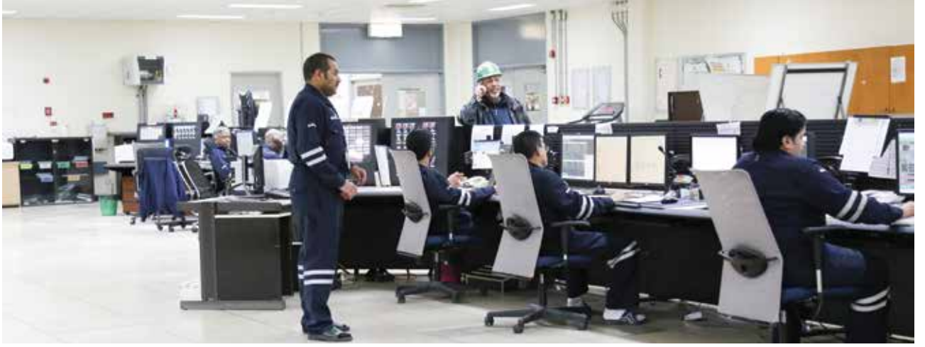
■ يعود النظام بالعديد من الفوائد للشركة والعاملين

الصحة والسلامة والبيئة، منذ بدء تطبيق النظام في فبراير 2017. وتتمثل مميزات تطبيق نظام الإبلاغ والتحقيق في الحوادث عبر «الماكسيمو» في: - الحد من الوقت الكلي وتقليص الفترة الزمنية المستغرقة في التحقيق في الحوادث. - توفير نظام واحد متكامل وشامل لجميع الحوادث التي قد تقع. - ربط المعلومات المتواجدة عبر نظام «الماكسيمو» كمعلومات الموارد البشرية بنظام الإبلاغ والتحقيق في الحوادث. - يتيح النظام تتبع التوصيات من التحقيق في الحوادث، بالإضافة لرسائل التنبيه للتذكير بإغلاق التوصيات المعلقة. - يتيح النظام حفظ وتخزين المعلومات والبيانات عن الحوادث، وذلك للرجوع إليها عند الحاجة. - مشاركة الدروس المستفادة من الحوادث. ومن الجدير بالذكر أن تطبيق نظام الإبلاغ والتحقيق في الحوادث بالشركة يعتبر أحد التطبيقات التي ستنم عن طريق منصة أعمال برنامج الماكسيمو، حيث ارتأت دائرة الصحة والسلامة والبيئة ضم معظم التطبيقات الخاصة بها لتكون تحت مظلة الماكسيمو مثل: IMS, PSSR, PAS.