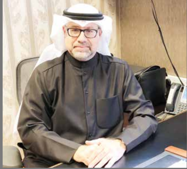
■ يؤكد الغواص أن ورش العمل تساعد على تحسين الربحية