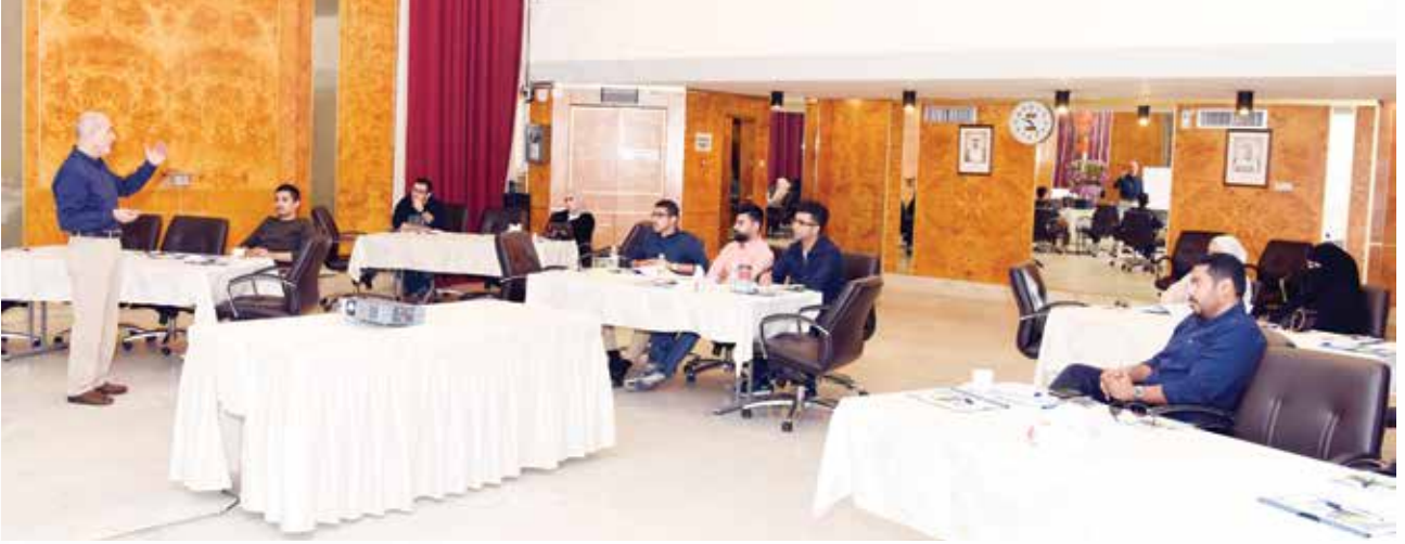
■ جانب من الدورة التدريبية التي خصصت لمهندسي التخطيط والتصنيع