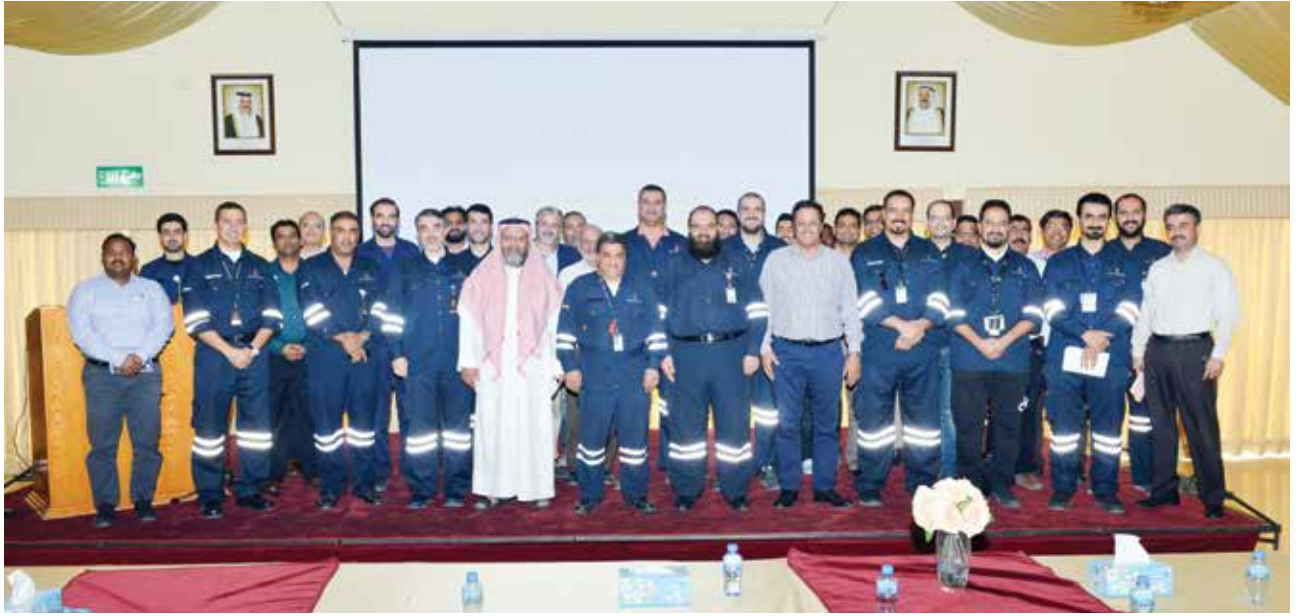
■ لقطة جماعية للمشاركين في محاضرة منهجية أدوات التحكم