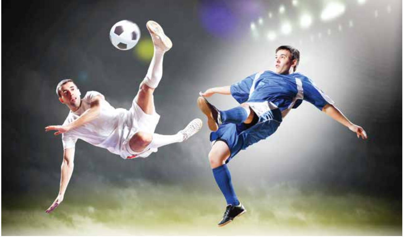
■ رياضة كرة القدم من بين الهوايات التي يعشقها الطفيري

للتعامل مع التحديات والصعوبات ومواجهة المتغيرات.