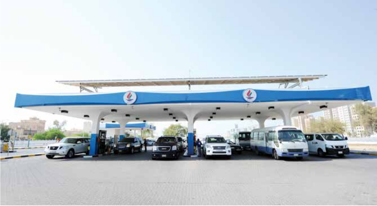
■ المحطات الجديدة ستساهم في الحد من الازدحام في المحطات القائمة