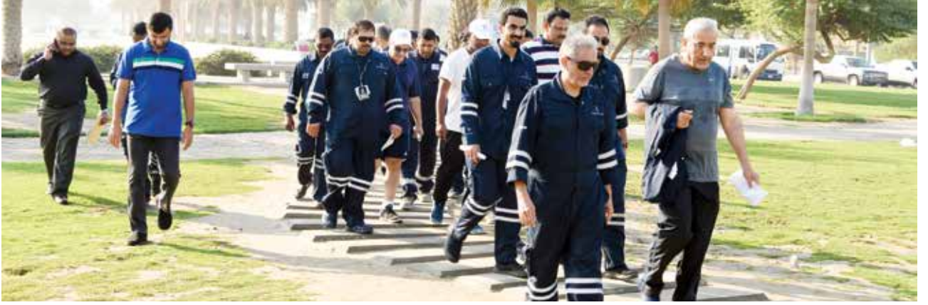
■ ممارسة الرياضة تعزز الصحة العامة وتقلل من احتمالات الإصابة بالأمراض