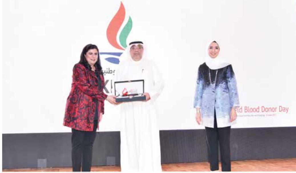
● تسليم الشركة درع الفائز بالمركز الثاني لهذا العام

جمع 85 ألف كيس دم و7500 كيساً من الصفائح الدموية