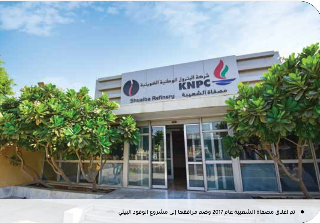
● تم إغلاق مصفاة الشعبية عام 2017 وضم مرافقها إلى مشروع الوقود البيئي