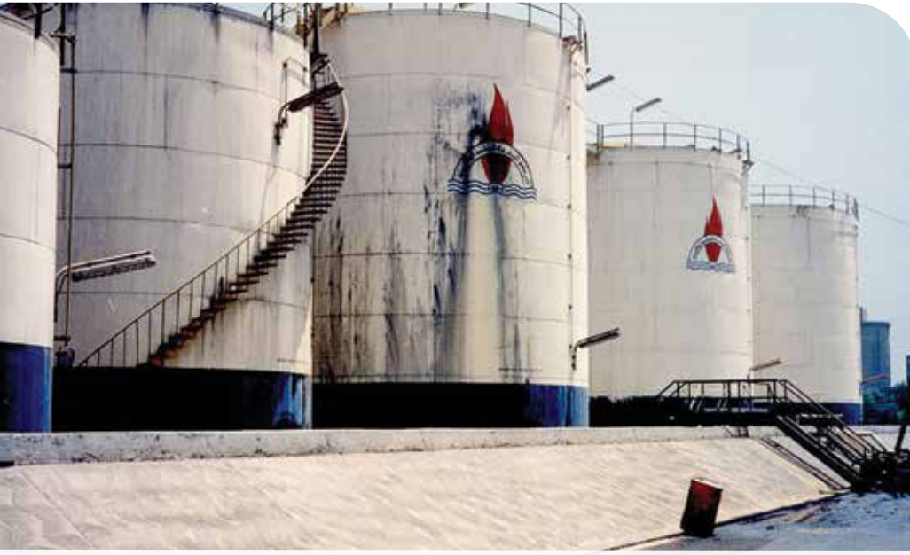
● خزانات النفط نالها هي الأخرى نصيباً من التخريب