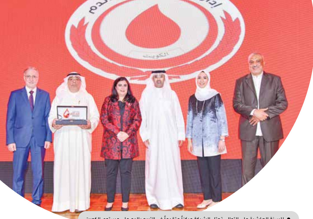
● للسنة العاشرة على التوالي تحتل الشركة مركزاً متقدماً في التبرع بالدم على مستوى الكويت