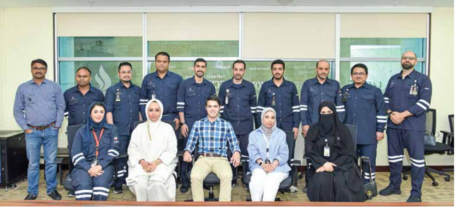
● لقطة للمشاركين في الدورة التدريبية

الكبيرة والفعالة، فقد تم تعريف وتدريب مجموعة من المهندسين من مصافي الشركة والأقسام الأخرى على التحديث الجديد المسمى (PIMS Unified)، وإطلاعهم على أبرز المميزات فيه.