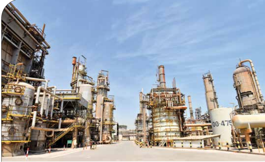
● تعزيز انتاجية مصافي النفط يتطلب تطوير قدراتها التقنية والبشرية

تحت اسم امسويل AMSOIL ومع ذلك، كان الجمهور بطيئاً في اعتماد زيت المحرك الاصطناعي الجديد من أماتوزيو على الرغم من الفوائد العديدة التي يوفرها مقابل زيوت التشحيم التقليدية. كان التحدي الأساسي هو السعر، حيث أن زيت المحركات الاصطناعي يكلف عدة مرات أكثر من زيت المحركات التقليدية.