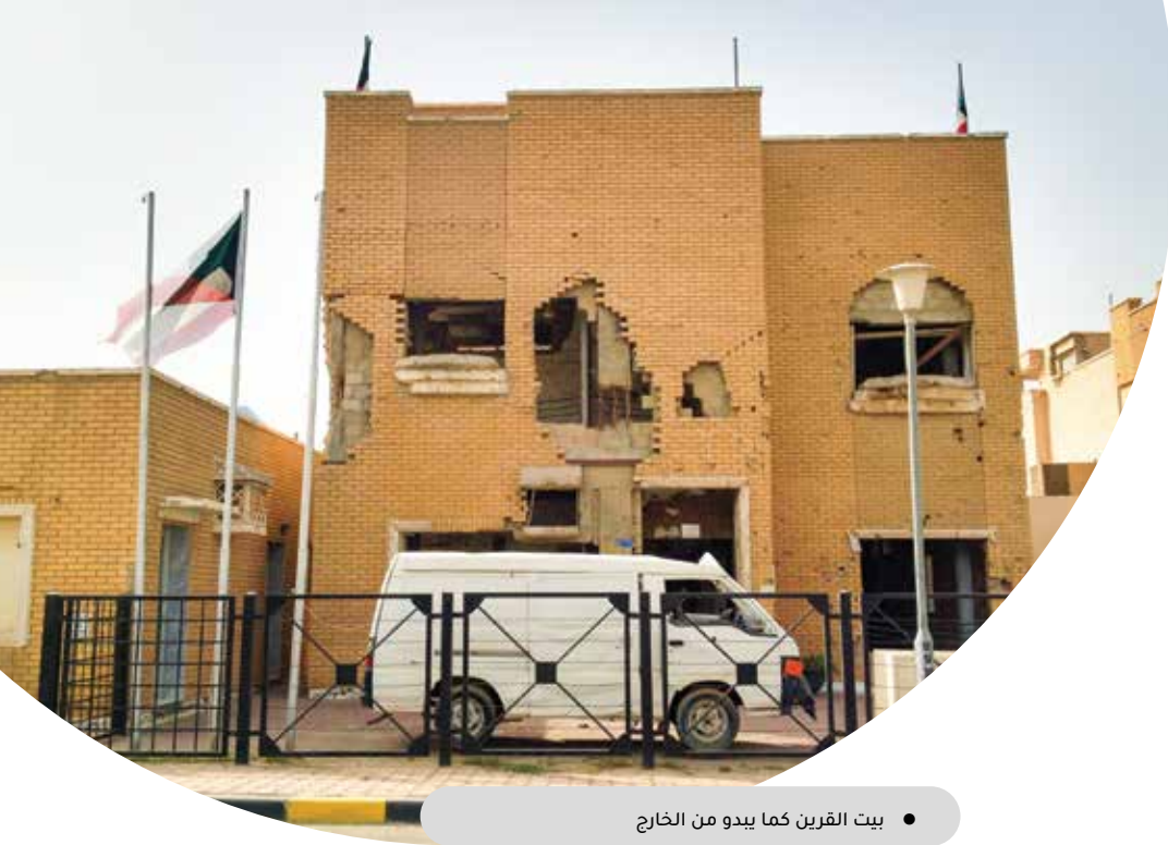
• بيت القرين كما يبدو من الخارج