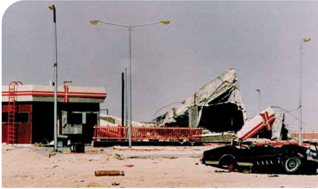
● آثار الدمار بادية على إحدى محطات الوقود التابعة للشركة

الحياة المدنية للحفاظ على أرواحهم إلى حين صدور أوامر أخرى بالمقاومة. وتوجهت للمصفاة الساعة 6 مساءً وهو موعد المناوبة، وحتى ذلك الحين لم نشهد دخول العراقيين إلى المصفاة، رغم انتشارهم في الطرق السريعة.