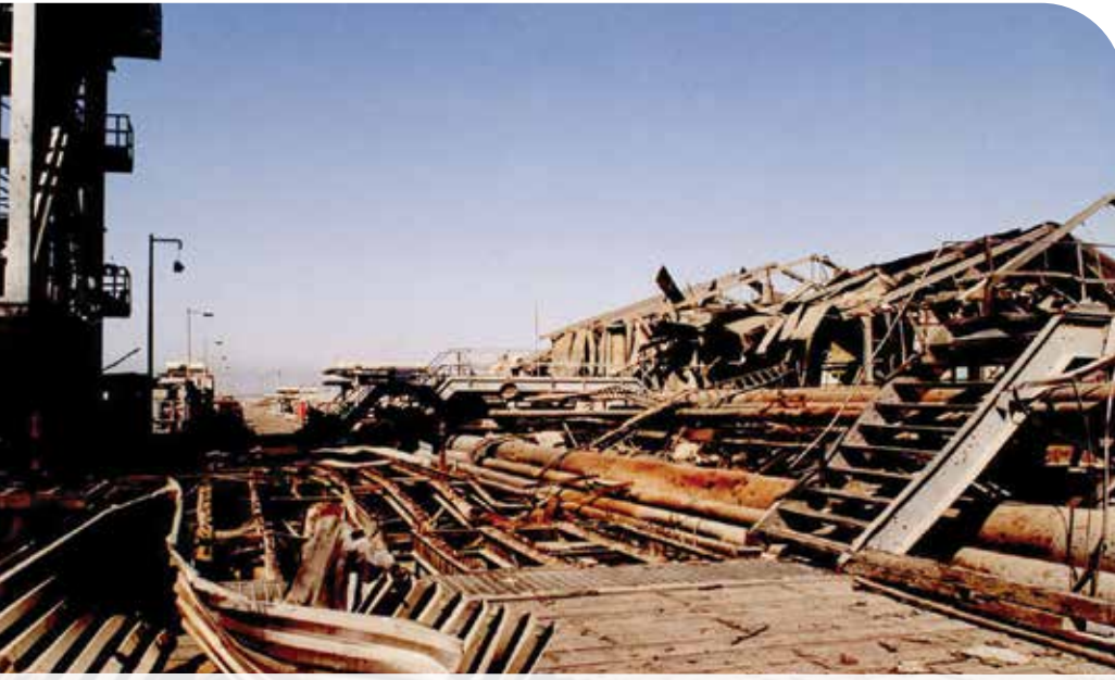
● نتيجة للدمار الهائل الذي لحق بمرافق ومعدات الشركة فقد بذلت جهود جبارة لإعادة الإعمار