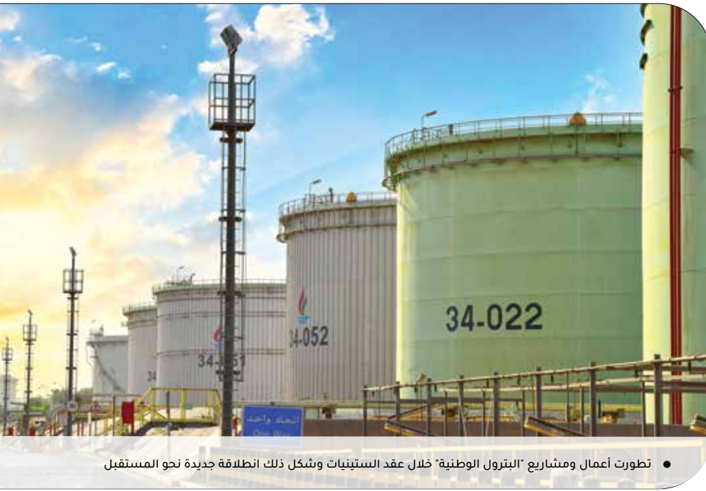
● تطورت أعمال ومشاريع "البتروال الوطنية" خلال عقد الستينيات وشكل ذلك انطلاقة جديدة نحو المستقبل