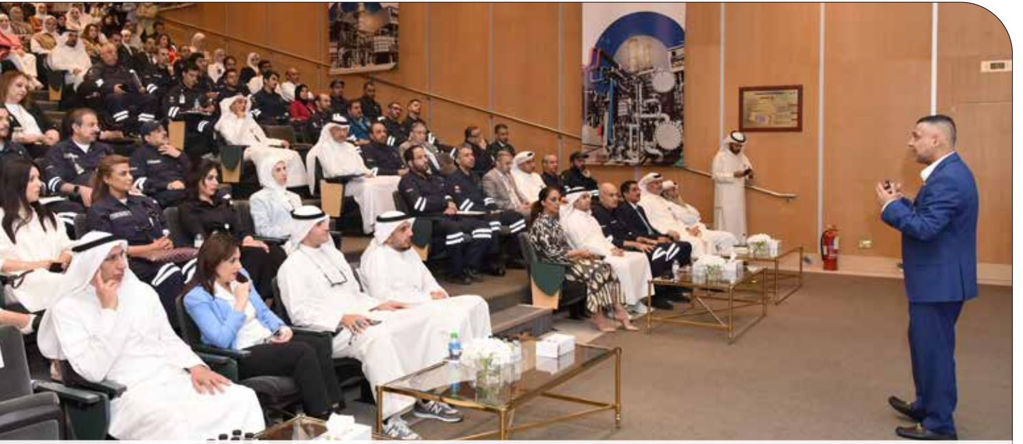
● جانب من الحضور في لقاء قصة النجاح الرقمية الأولى