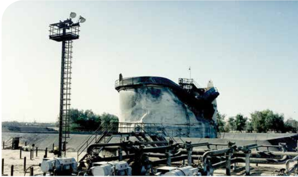
● خزان للنفط تعرض للقصف خلال عمليات تحرير الكويت

والقنابل والقذائف غير المنفجرة المخفية على جانبي الطريق، إلى أن تم تأمينها وإزالتها.