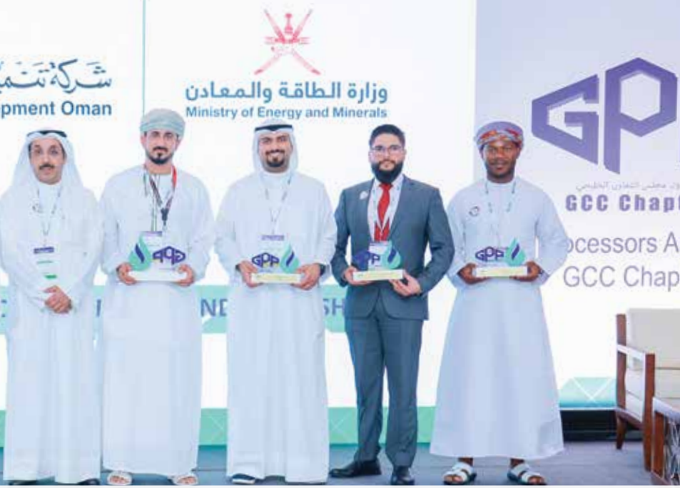
● تكريم عدد من المشاركين في أعمال المؤتمر