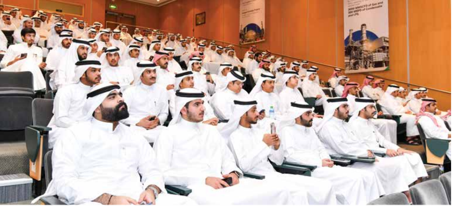
● تهتم "البتترول الوطنية" بتوظيف الشباب الكويتي في كافة أقسامها ومرافقها