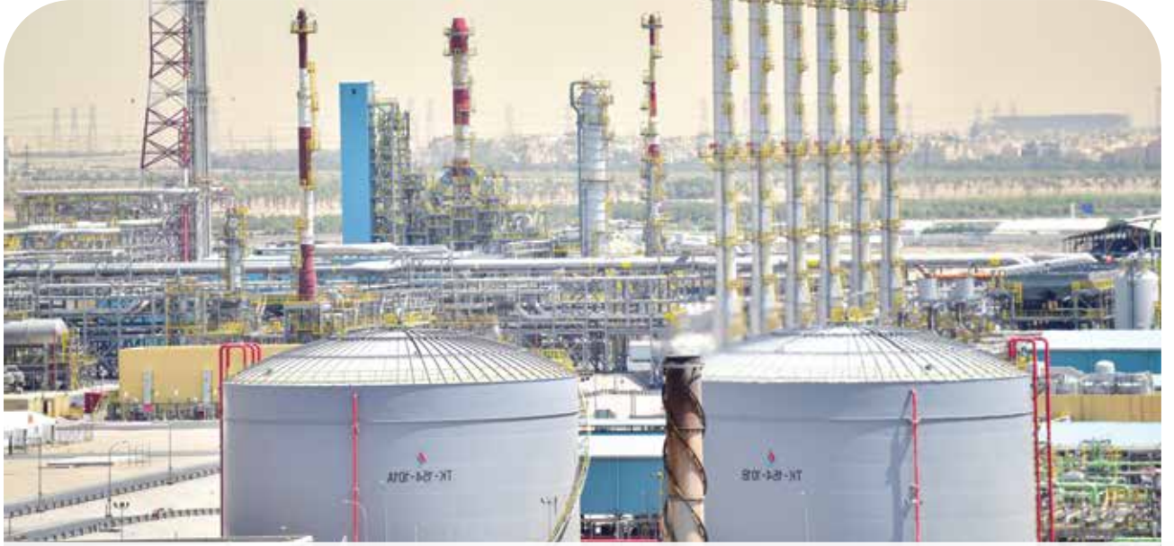
● متابعة طلبات الشراء التي ترد من المصافي ومن التسويق المحلي