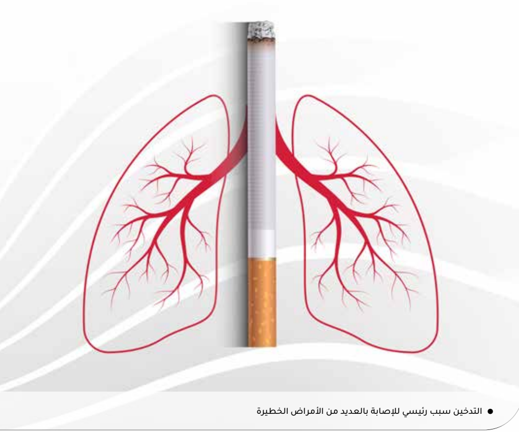
● التدخين سبب رئيسي للإصابة بالعديد من الأمراض الخطيرة

” يزيد التدخين من احتمالات الإصابة بمرض السرطان